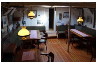
Urig, gemütlicher Salon