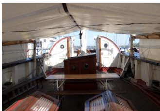
Überdachtes, wettergeschütztes Achterschiff