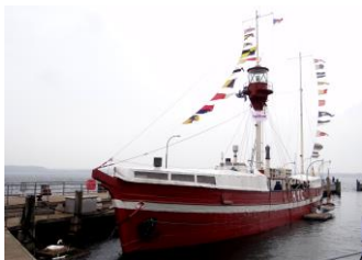
Laesoe Rende im Fischereihafen Møltenort