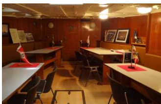
Schulungsraum im Vorschiff