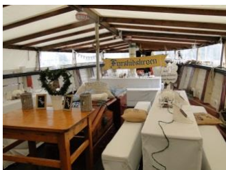
Maritim dekoriertes Vorschiff (überdacht)